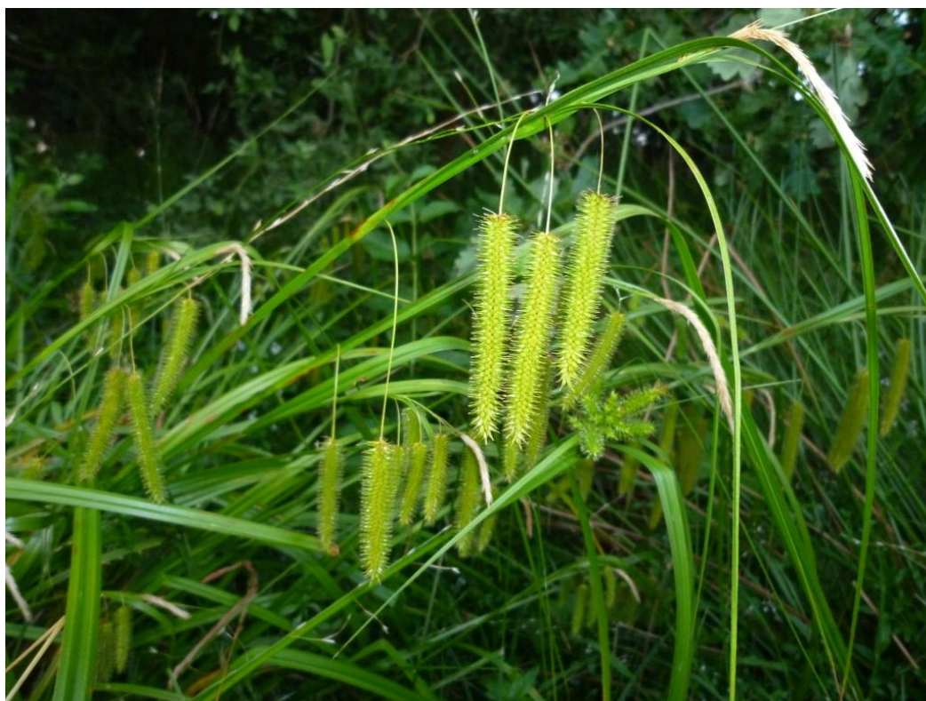
Hoge cyperzegge (na veel discussie)